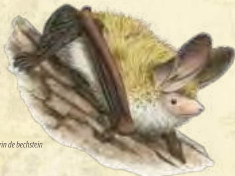
Murin de bechstein

Animation animée autour d'un piège à papillon. Capture (matériel spécifique) et démarche d'identification (ouvrages mis à disposition). Matériel de détection et de reconnaissance des chauve-souris (propice à proximité d'une zone humide) et écoute de rapaces nocturnes.