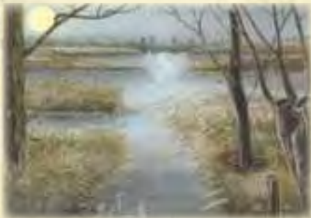
Paysage des Marais d'Isle

Renseignements et inscriptions : Maison de l'environnement au 03.23.05.06.50 ou maison.environnement@saint-quentin.fr ou l'Office de tourisme au 03.23.67.05.00.