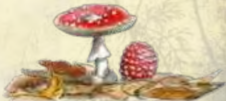
Amanite tue mouche