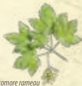
Erable de sycomore rameau