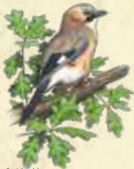
Geai des chênes