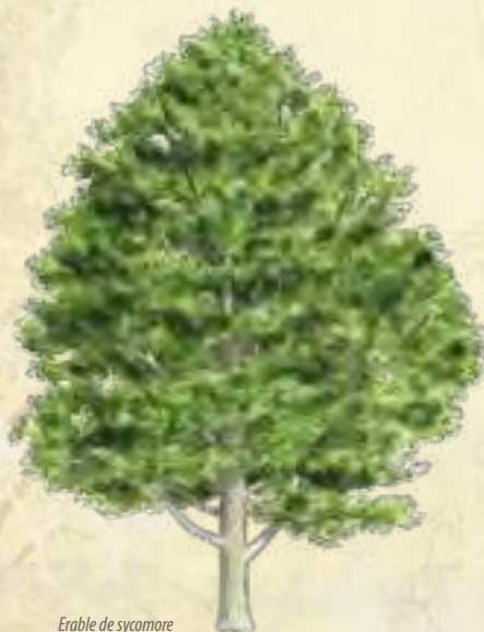
Erable de sycomore

Sortie organisée par l'AMSAT des marais de la Souche, avec le soutien de l'Agence de l'Eau Seine Normandie et le partenariat de l'Association des Parents d'élèves de l'école des marais.